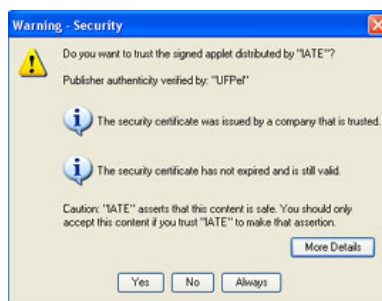
Figura 4 – tela de entrada do applet

Os applets assinados são amplamente utilizados em páginas Web de bancos, pois esses constituem uma forma segura de execução, visto que antes de executar o applet é exibida uma tela informando a origem do mesmo, perguntando-se ao usuário se ele considera de confiança tal instituição e se deseja prosseguir a execução do applet, sendo assim, o usuário possui uma garantia maior que esse não é de conteúdo malicioso e destrutivo. Na figura 4 é mostrada a tela referente à assinatura do applet desenvolvido como protótipo.