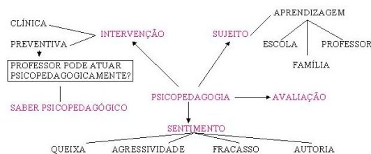
Figura 1: Exemplo de mapeamento conceitual, constante no memorial avaliativo individual final.

Em relação ao mapeamento de percursos conceituais individuais produzidos no decorrer da disciplina, uma das alunas, ao rever seus próprios registros, construiu um mapa onde diferentes conceitos como, por exemplo, afetividade, aprendizagem, psicopedagogia, intervenção, avaliação, colocam-se em relação – conforme é possível observar na figura a seguir (Figura 1).