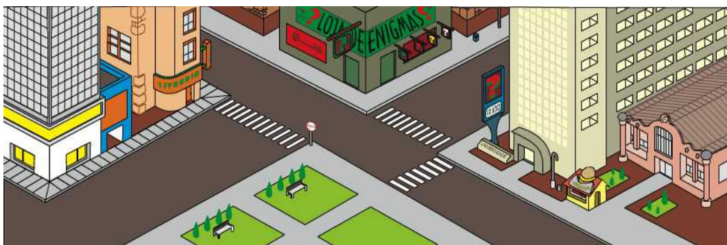
Figura 3 - Tela do objeto de aprendizagem de Matemática mostrando uma “Cidade”.

Na tela inicial, veja Figura 3, o aluno tem como plano de fundo para as atividades, uma cidade onde ele visualiza vários ícones, que ao serem “clikados” levam para outras telas, onde de fato eles deverão resolver o problema proposto, experimentando as várias situações do cotidiano. Essa tela foi planejada para que o aluno perceba que o conteúdo que é tema do Objeto, está presente em sua vida, fazendo com que ele se sinta motivado a prosseguir com a atividade.