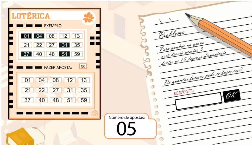
Figura 4 – Tela do objeto de aprendizagem de Matemática relatando os números em uma “Lotérica”.

Nessa tela da casa lotérica o aluno deverá simular uma aposta na Quina, marcando cinco números dos quinze disponíveis, após fazê-lo o aluno aperta no botão OK . O número máximo de apostas será de cinco, ao final do experimento o aluno deverá perceber que esse é um problema onde a ordem dos elementos não importa, o que o caracteriza como um problema de combinação. Percebe-se que nessa atividade, o aluno é levado a fazer uma simulação de um jogo, que certamente ele já fez em algum momento de sua vida e que talvez não tenha percebido que esse pode ser um problema de análise combinatória.