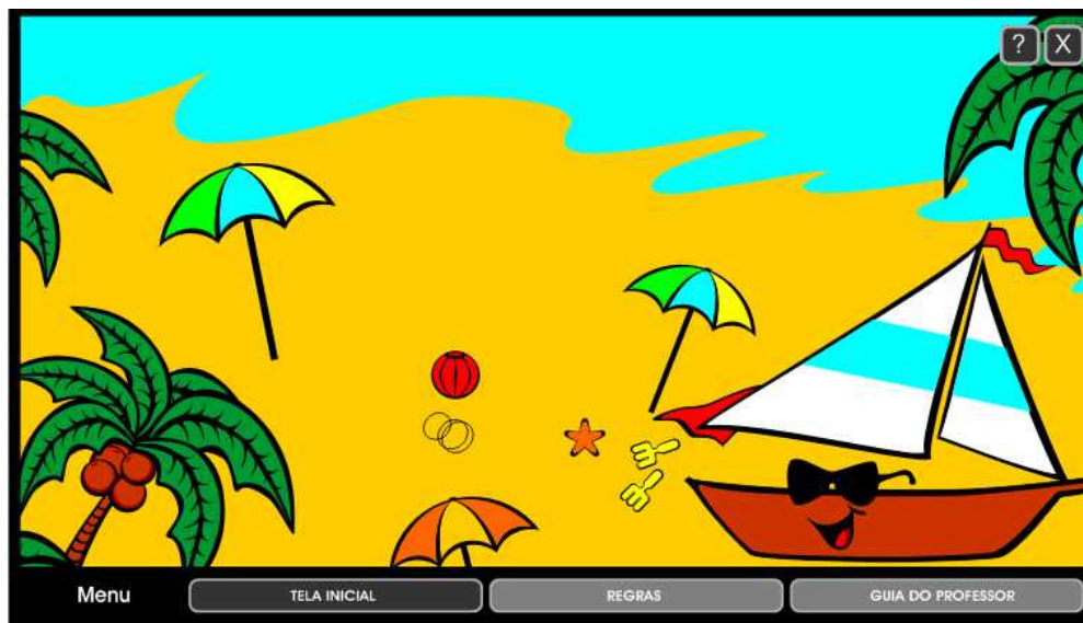
Figura 2 – Tela de escolhas de atividades no objeto de língua portuguesa